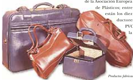
Productos fabricados con PVC reciclado

El Consejo Europeo de Productores de Vinilo (ECVM) ha encomendado a Solvay el desarrollo de un plan piloto destinado a crear un nuevo proceso de reciclado para el PVC . El objetivo es desarrollar soluciones sostenibles para el reciclado del PVC y optimizar el rendimiento ambiental del producto durante todo su ciclo de vida, incluyendo su etapa final como residuo.